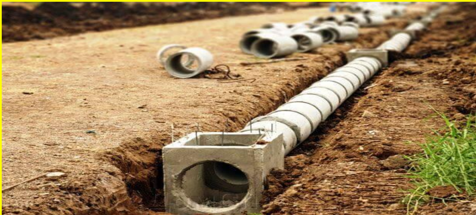
2 сурет- Жерге қолданылатын құрғату дренаж көрінісі