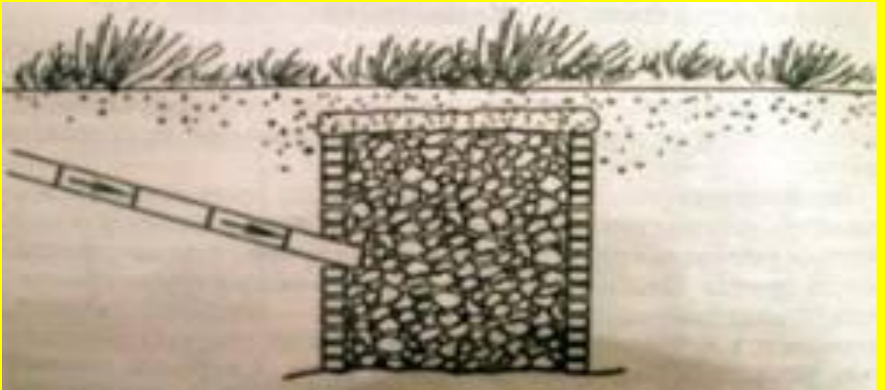
4 сурет - Жер мелиорациясында қолданылатын дренаж