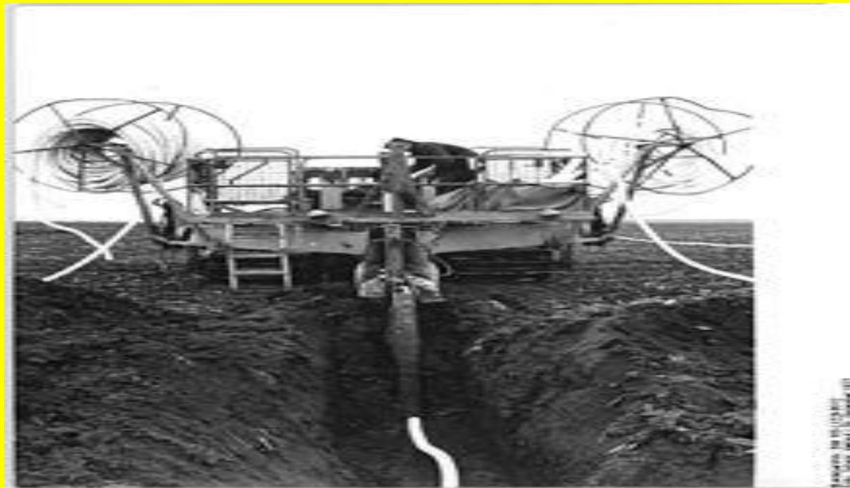
3 сурет - Дренажды машина